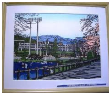
新大塚公園 (東京都・大塚)