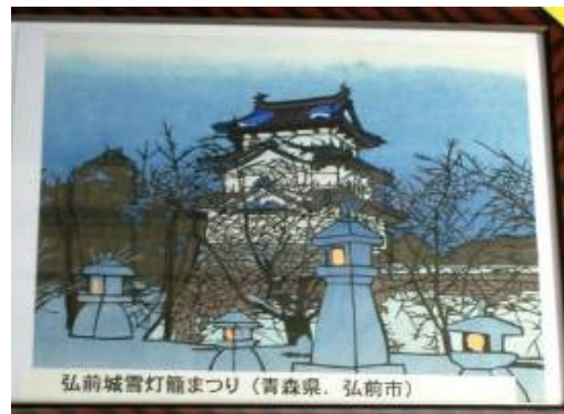
弘前城雪灯籠まつり (青森県、弘前市)