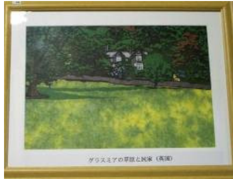
グラスミアの草屋と民家 (英国)