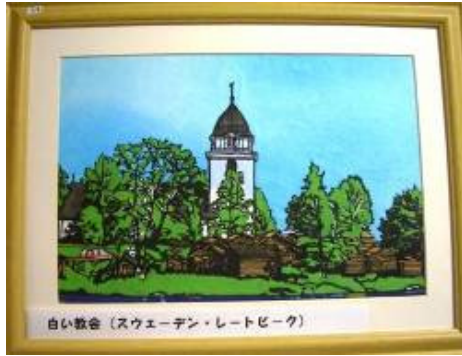
白い教会 (スウェーデン・レートビーク)