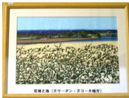
花畑と海 (スウェーデン・スコネ地方)