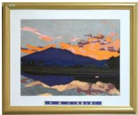
夕陽の輝き (スウェーデン・ストックホルム)